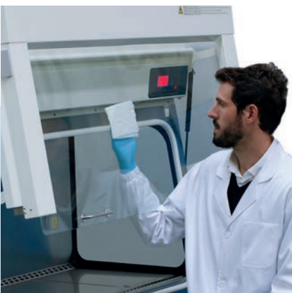
Fácil limpieza del interior del cristal.

La serie Bio II Advance Plus incorpora una pantalla a color que permite comprobar fácilmente y con rapidez los parámetros relacionados con la seguridad. Muestra de forma visual el nivel de colmatación de los filtros, lo cual es extremadamente útil para optimizar el servicio técnico, y la velocidad del flujo laminar para controlar en todo momento el estado de la cabina.